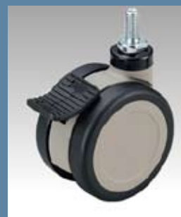
100φ自在 ダブルストッパー付ウレタン車

耐摩耗性、耐油性に優れています。 ダブルストッパー付は、車輪の回転と 軸の旋回をワンアクションで止める事 ができ、ワークテーブルをしっかり 固定できます。