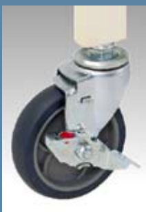
100φ自在 エラストマー車