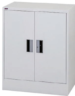
誘導扉 CLOSE 時