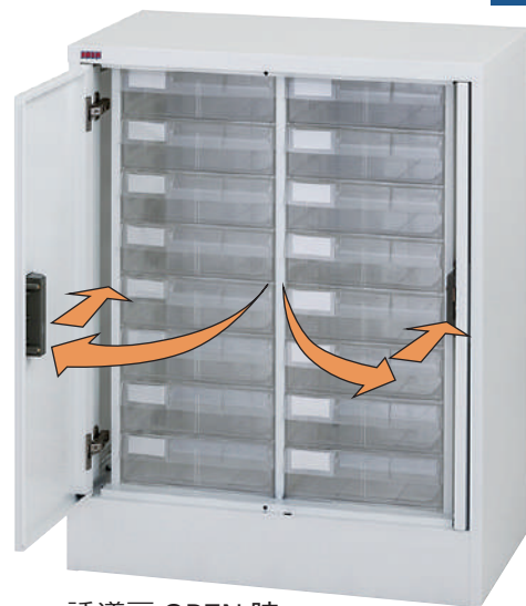
誘導扉 OPEN 時

誘導扉OPEN時 扉は本体へ収まります ので、日常業務や通行の 邪魔になりません