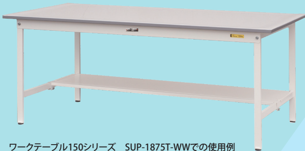
ワークテーブル150シリーズ SUP-1875T-WWでの使用例 マットは透明ですので、作業台などの 外観はほとんど変化せずにお使いいただけます。