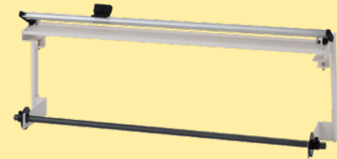
ロール材スタンド 吊り下げタイプ らくらく cutter 付き RS-RTS1200