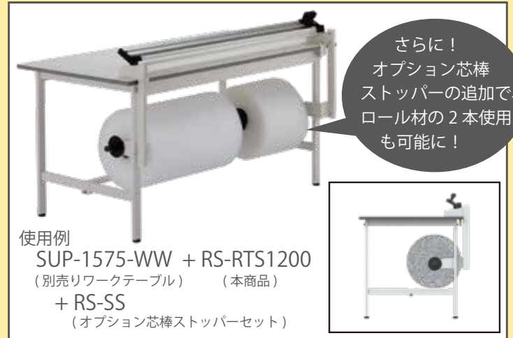
使用例 SUP-1575-WW + RS-RTS1200 (別売りワークテーブル) (本商品) + RS-SS (オプション芯棒ストッパーセット)