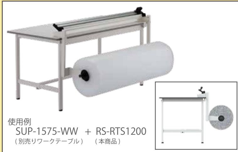
使用例 SUP-1575-WW + RS-RTS1200 (別売りワークテーブル) (本商品)