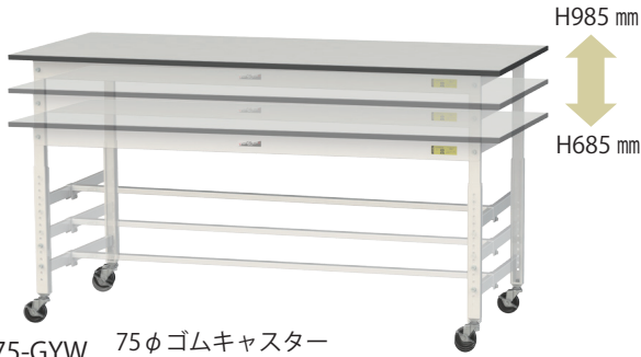
SURAC-1875-GYW 75φゴムキャスター 自在ストッパー付×4個