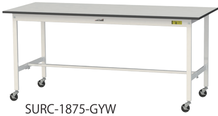
SURC-1875-GYW 75φゴムキャスター 自在ストッパー付×4個