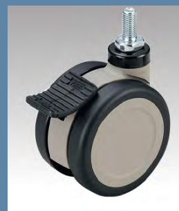
100φ自在 ダブルストッパー付ウレタン車

耐摩耗性、耐油性に優れています。 ダブルストッパー付は、車輪の回転と 軸の旋回をワンアクションで止める事 ができ、ワークテーブルをしっかりと 固定できます。