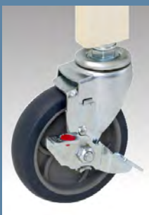
100φ自在 エラストマー車