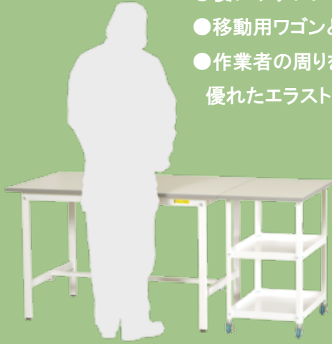
ワークテーブルの横にセットした使用例 SUP-1275-WW + HTC-7545W