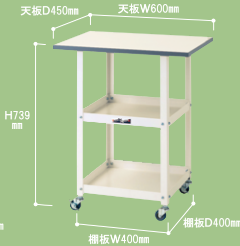
HTC-6045W ¥28,000 キャスター:50φエラストマー車輪 質量 :10.6kg