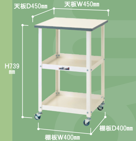
HTC-4545W ¥27,900 キャスター:50φエラストマー車輪 質量 :9.7kg