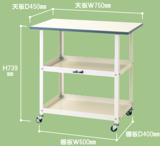
HTC-7545W ¥33,150 キャスター:50φエラストマー車輪 質量 :12.9kg